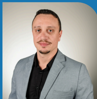
CHRISTOFER S. ASSIS PRODUTOS E SERVIÇOS

“A ACIC tem a inovação em seu horizonte, buscando no presente, parcerias profissionais integrando a comunidade empresarial com as melhores práticas do mercado.”